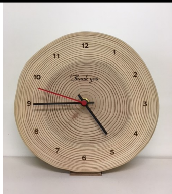
■文字盤は、2タイプから選べます